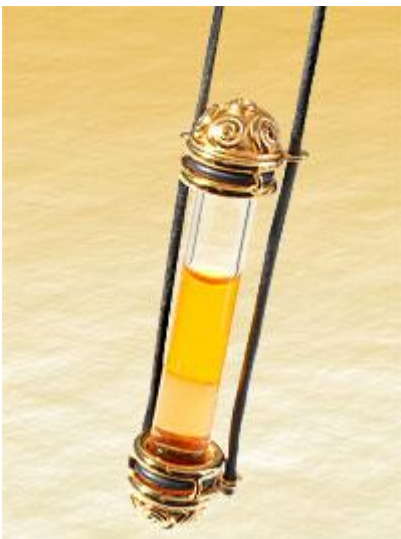
'Aura Soma' Schmuck